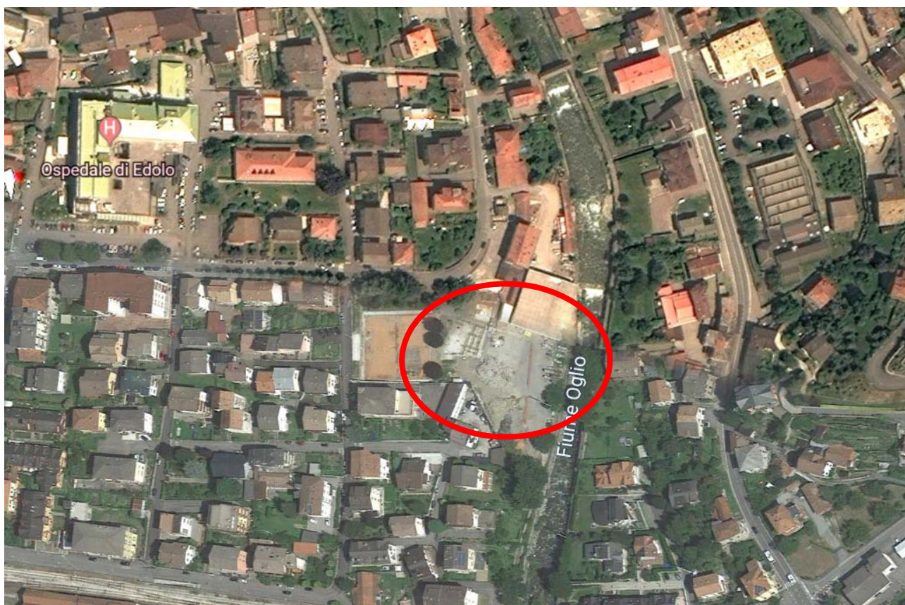
Fotografia 1: Vista aerea della zona oggetto di intervento

Il presente piano di sicurezza e coordinamento si riferisce ai lavori di realizzazione nuova area verde in via A. Gelpi e collegamento con passerella ciclopedonale al percorso lungo il fiume Oglio in ampliamento dell'impianto sportivo esistente sito in comune di Edolo (BS).